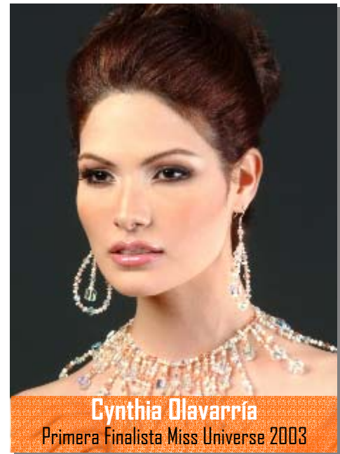
Cynthia Olavarría Primera Finalista Miss Universe 2003